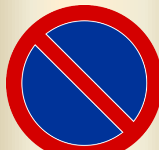
B-35 zakaz postoju