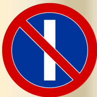
B-37 zakaz postoju w dni nieparzyste