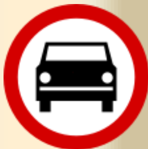
B-3 zakaz wjazdu pojazdów silnikowych z wyjątkiem motocykli jednośladowych