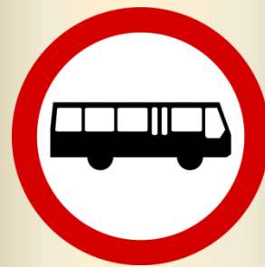
B-3a zakaz wjazdu autobusów