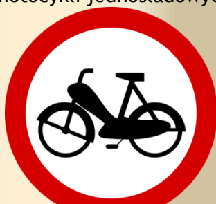
B-10 zakaz wjazdu motorowerów