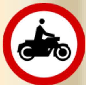
B-4 zakaz wjazdu motocykli